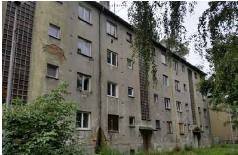
Stávající stav domu Na Vyhlídce je velmi neutěšený a už několik let tam nikdo nebydlí. Město postupně zbourá tři takové domy.

Klienti karvinské Hornické nemocnice mají nově k dispozici 22 nových parkovacích míst (20 + 2 ZTP) v jedné z přilehlých ulic (U Bažantnice); město investovalo do výstavby 1,3 milionu korun. Na podzim začne výstavba 42 míst v ulici Sportovní a menšího parkoviště pro 19 aut u jednoho z přilehlých domů. Nemocnice dlouhodobě řeší nedostatek parkovacích míst ve svém okolí a karvinská radnice tak jejím klientům vychází nyní vstříc. Obě posledně jmenovaná parkoviště by měla být hoto-