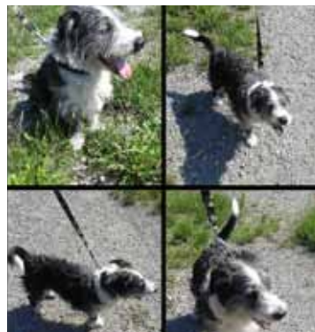
REK, pes, 5 let, šedobílý.