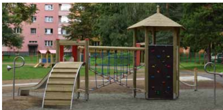
Do zahrady MŠ Na Kopci přibyla nová herní sestava.

„Do oprav školních budov a zahrad investujeme každoročně, už téměř na všech budovách máme vyměněná okna a postupně školy také zateplujeme. Investujeme ale samozřejmě i do vybavení, aby se děti učily v moderním a motivujícím prostředí a měly k dispozici špičkové technologie,“ vysvětlil primátor Tomáš Hanzel.