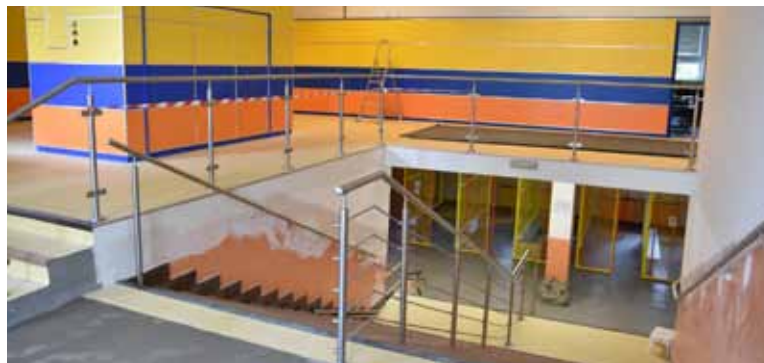
V ZŠ U Lesa je opraven vstupní prostor a dovybavena je kuchyň.

Některé mateřinky mají vylepšené zahrady, což radnici stálo tři miliony. V Zahradě MŠ Čajkovského tak přibyl sáňkovací kopec, houpadlo, lanový park, pyramidy, opravily se chodníky a plochy. Nová herní sestava obohatila zahradu také u MŠ Na Kopci, MŠ V Aleji a MŠ Prameny, úprav se dočkala i zahrada patřící k MŠ Školské. „Nové herní