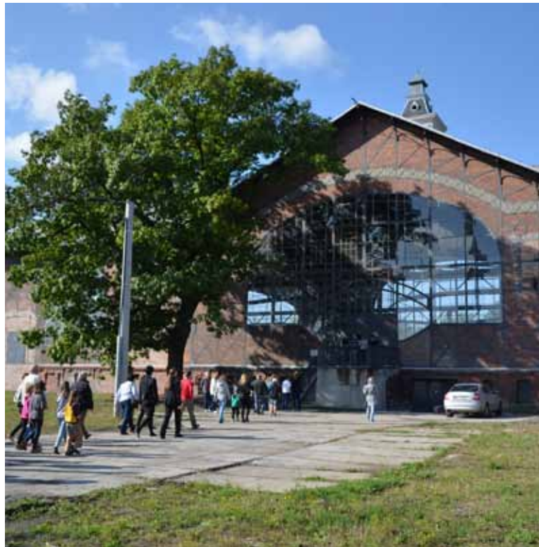
Státní podnik Diamo výjimečně pro Dny evropského dědictví zpřístupní opět po roce areál bývalé šachty Barbora v Dolech včetně těžní věže, a to v sobotu 10. září od 10 do 16 hodin. Zazpívají tam před polednem i Permonici.

Dny, místa a časy prohlídek na www.karvina.cz a www.zamek-frystat.cz .